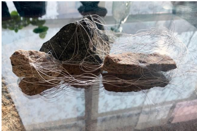
香港藝術家林嵐〈在迷你禪園散步〉，來自隔離營的石頭、線、夜光顏料，2020。

隨著「disCONNECT LDN」於英國落幕，展覽現移師香港，並邀請四位香港藝術家繼續在疫情中進行藝術對話，促進文化交流。香港藝術家 Go Hung、林嵐、黃國才，及黃鼎豐將為「disCONNECT HK」創作場地特定作品包括錄像裝置、現場繪畫、混合媒介及雕塑，回應 2019 冠狀病毒病疫情及「disCONNECT LDN」。