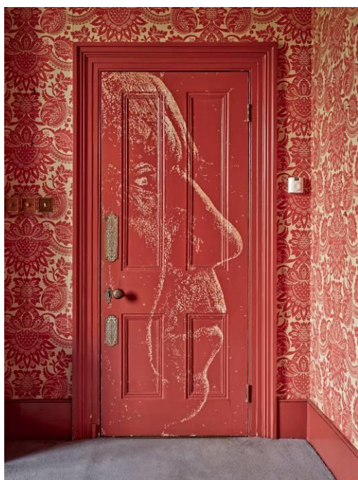
葡萄牙藝術家 Vhils 作品，裝置相片 倫敦 Schoeni Projects disCONNECT LDN (2020)。

預展: 2020 年 10 月 10 日 展覽日期: 2020 年 10 月 11 日至 11 月 29 日 網上展覽: 2020 年 10 月 24 日起