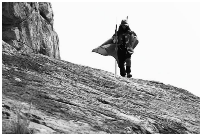
香港藝術家黃國才〈檢疫〉，錄像裝置，2020。

隨著「disCONNECT LDN」於英國落幕，展覽現移師香港，並邀請四位香港藝術家繼續在疫情中進行藝術對話，促進文化交流。香港藝術家 Go Hung、林嵐、黃國才，及黃鼎豐將為「disCONNECT HK」創作場地特定作品包括錄像裝置、現場繪畫、混合媒介及雕塑，回應 2019 冠狀病毒病疫情及「disCONNECT LDN」。