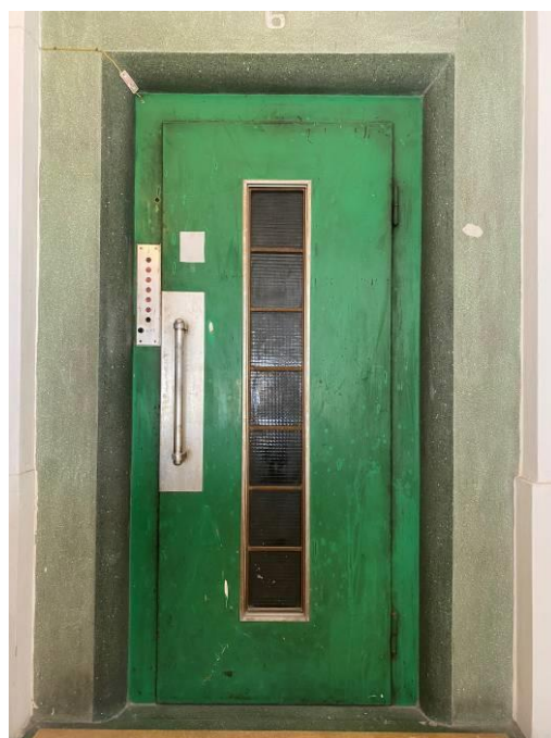
香港舊式公寓升降機門原貌 disCONNECT HK 展場