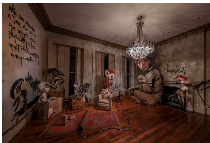
柏林藝術家二人組 Herakut 作品〈沉默的爭鬥〉，disCONNECT LDN，裝置相片，倫敦 2020。

「disCONNECT」展覽回應 2019 冠狀病毒病疫情，並探索疫情中的連繫、歸屬、隔離以及科技依賴等種種議題。由密鑼緊鼓的籌備過程到實際展出，整個展覽計劃都在回應全球性的封鎖、防疫與限制。